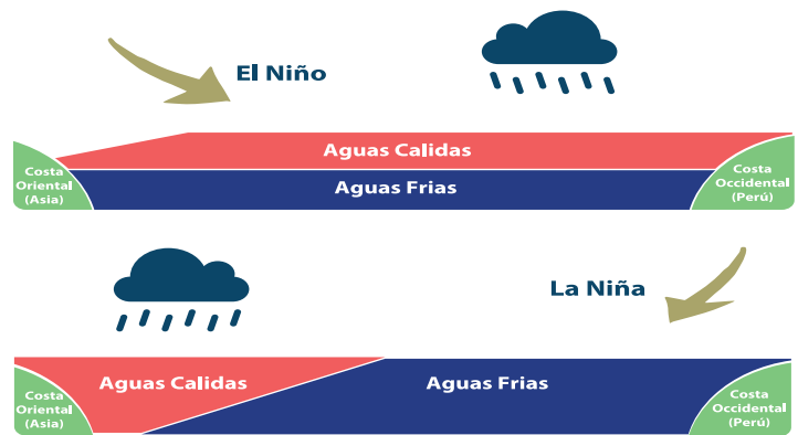
Figura: Oscilación del Sur. Fuente: Asociación Peruana de Pesca Deportiva

Tomando de referencia los análisis realizados por instituciones internacionales como la NOAA, Oficina Meteorológica de Australia y lo expresado por el Centro de Estudios Atmosféricos Oceanográficos y Sísmicos (COPECO-CENAO), indican que actualmente se encuentra una condición temporal neutral con la probabilidad que evolucione a niño durante al segundo semestre del año.